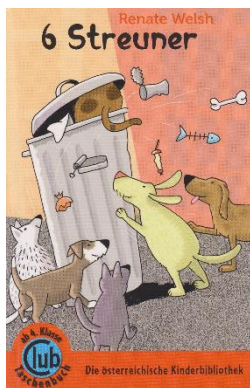
Renate Welsh Band 319: 6 Streuner

Die Bestellung erfolgt über den Buchklub.